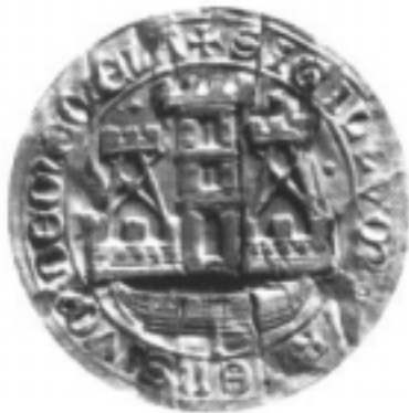
Segl fra 1619.

Nogle år senere, i 1629, erobrede svenskerne byen - og sad på den i 6 år. I den følgende tid satte tyske købmænd og adelsmænd sig tungt på byen. Litauere måtte bosætte sig i byen, men de måtte ikke arbejde som købmænd eller håndværkere, kun som hjælpearbejdere. I 1757 erobrede den russiske flåde byen og holdt den i 5 år - og 1806-07 fungerede byen som hovedstad for Preussen et års tid, fordi Napoleon havde erobret Berlin og fordrevet det preussiske hof dérfra.