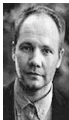
Peter Englund er midt i '40-erne - han er født i 1957. Han er historiker af uddannelse og har snart mange populære bøger bag sig. For ikke længe siden blev han professor i Stockholm - og her i år blev han medlem af Det Svenske Akademi

Englund minder os om at en hær ikke blot var mænd i våben. Der var mindst lige så mange civile med. Koner til de indrullerede - og børn. Marketendersker. Håndværkere. Ruffersker og mange mange flere. Hver gang hæren skulle flytte sig, skulle utrolige mængder af vogne og civilister også flyttes - og selv om det vel ikke altid var hærchefens ansvar, måtte han og hans transportfolk tænke i meget »brede baner« for at tingene kunne lade sig gøre, og for at de »civile« kunne hjælpe hæren og ikke blive den en klods om benet.