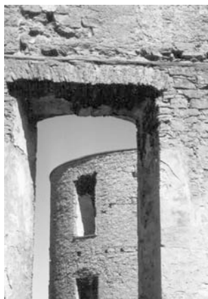
Borgholm Slot på Öland. Restaureret af den ældre Nikodemus Tessin under Karl Gustavs tid på øen. Omfattende brand 1806. Tessin har også bygget domkirken i det nærliggende Kalmar. Stilen var hvad man kalder italiensk barok .

Der er mange personer i bogen; nogle enkelte er med det meste ad vejen, andre kun et stykke - hvad der svarer til dén skæbne der overgik de mange der blev hvervet til krigen, for det var langt fra alle der vendte levende hjem. Karl Gustav er uden sidestykke den bærende, og han vejer godt til, ikke blot i den mest bogstavelige forstand. Den gode Karl har ikke lidt af anorexi, tværtimod gik han fra at være en buttet lille dreng, til at blive småfed og lasket for så - til sidst - i 30'erne at blive noget mere end almindelig overvægtig. At det gik ham sådan havde sine naturlige grunde - han drak og drak og spiste og spiste, og selv om han var aktiv både i og uden for sengen, oversteg indtagelsen af kalorier så helt og aldeles de fysiske strabadser, men en doven karl var han dog langt fra.