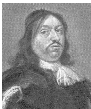
Karl X Gustav. Udsnit af maleri på Gripsholm Slot.

Der er mange personer i bogen; nogle enkelte er med det meste ad vejen, andre kun et stykke - hvad der svarer til dén skæbne der overgik de mange der blev hvervet til krigen, for det var langt fra alle der vendte levende hjem. Karl Gustav er uden sidestykke den bærende, og han vejer godt til, ikke blot i den mest bogstavelige forstand. Den gode Karl har ikke lidt af anorexi, tværtimod gik han fra at være en buttet lille dreng, til at blive småfed og lasket for så - til sidst - i 30'erne at blive noget mere end almindelig overvægtig. At det gik ham sådan havde sine naturlige grunde - han drak og drak og spiste og spiste, og selv om han var aktiv både i og uden for sengen, oversteg indtagelsen af kalorier så helt og aldeles de fysiske strabadser, men en doven karl var han dog langt fra.