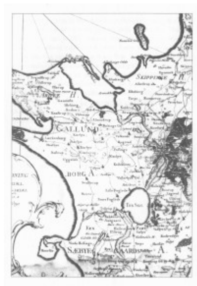
Udsnit af kort fra Videnskabernes Selskab 1771; optrykt fra bogen. Ugerløse er her stavet: Uggeløse. Landsbyen ligger lidt nord for »borg«. Hvis du klikker på kortet eller på det flg.

En bonde fra Ugerløse lidt syd for Kalundborg var forsvundet engang i slutningen af november 1734. Han var gået hjemmefra med nogle svin for at sælge dem i byen, men var forsvundet et sted på tilbagevejen. Hvad var der sket? Han havde muligvis været hos natmanden ved Skt. Jørgensbjerg for at købe dyrehår til sin bedrift; man kunne frygte at han var »faldet i« og siden faret vild på det øde stykke ned mod Ugerløse og død af kulde; men måske var han blevet ombragt?